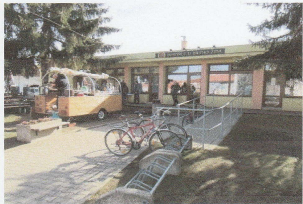
Obr. - Kontrola u Bílého Žida v Tuhani